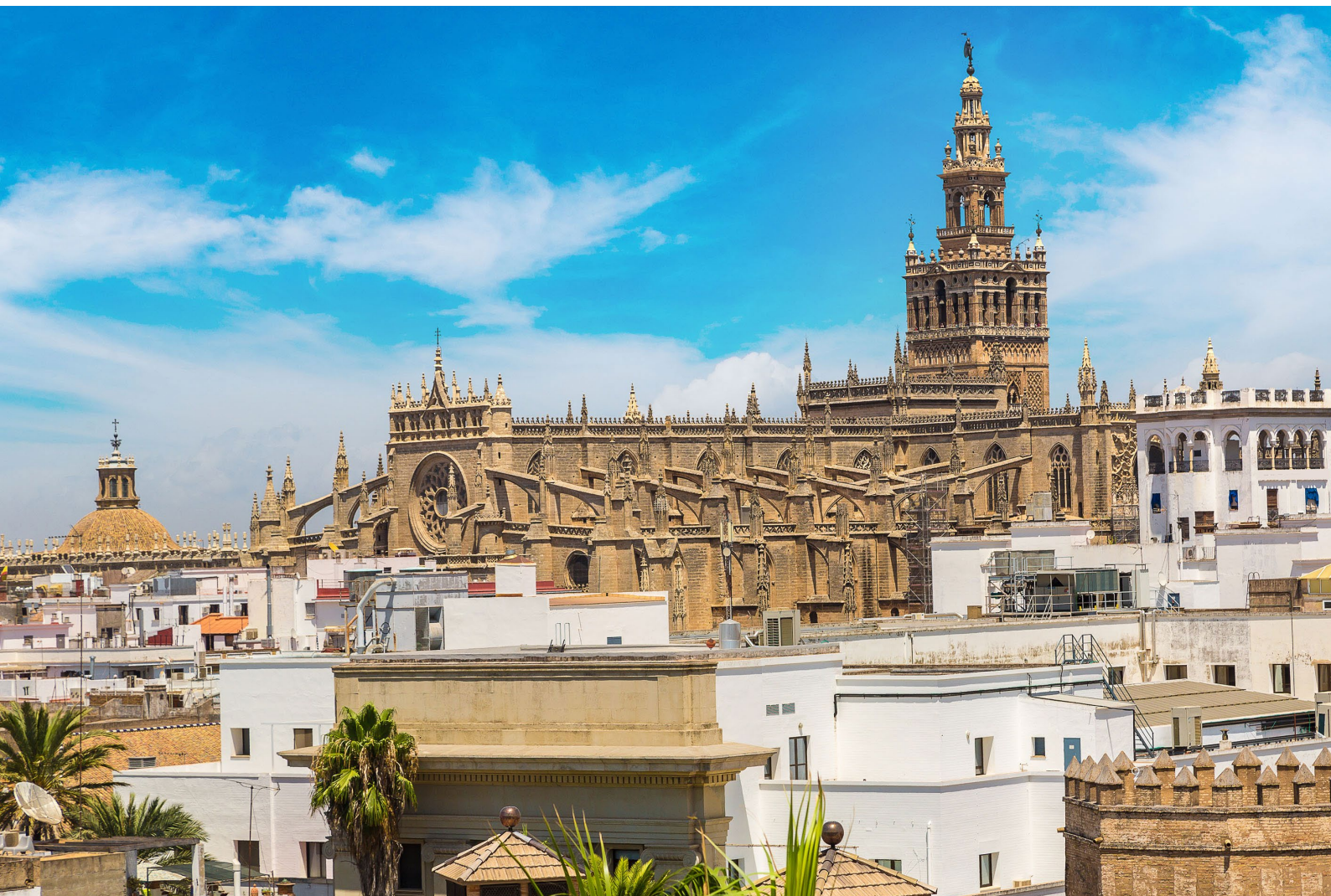
▼ 圣母玛利亚教堂 塞维利亚

如果你在圣周 (Semana Santa) 或四月节 (Feria de Abril) 期间旅行，就可以观赏到全国最富有感染力的两个节日。