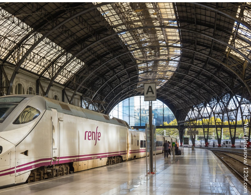
▲ 法国车站 巴塞罗那

西班牙工业和旅游部 出版：© Turespaña 撰写：Lionbridge NIPO: 086-17-060-7