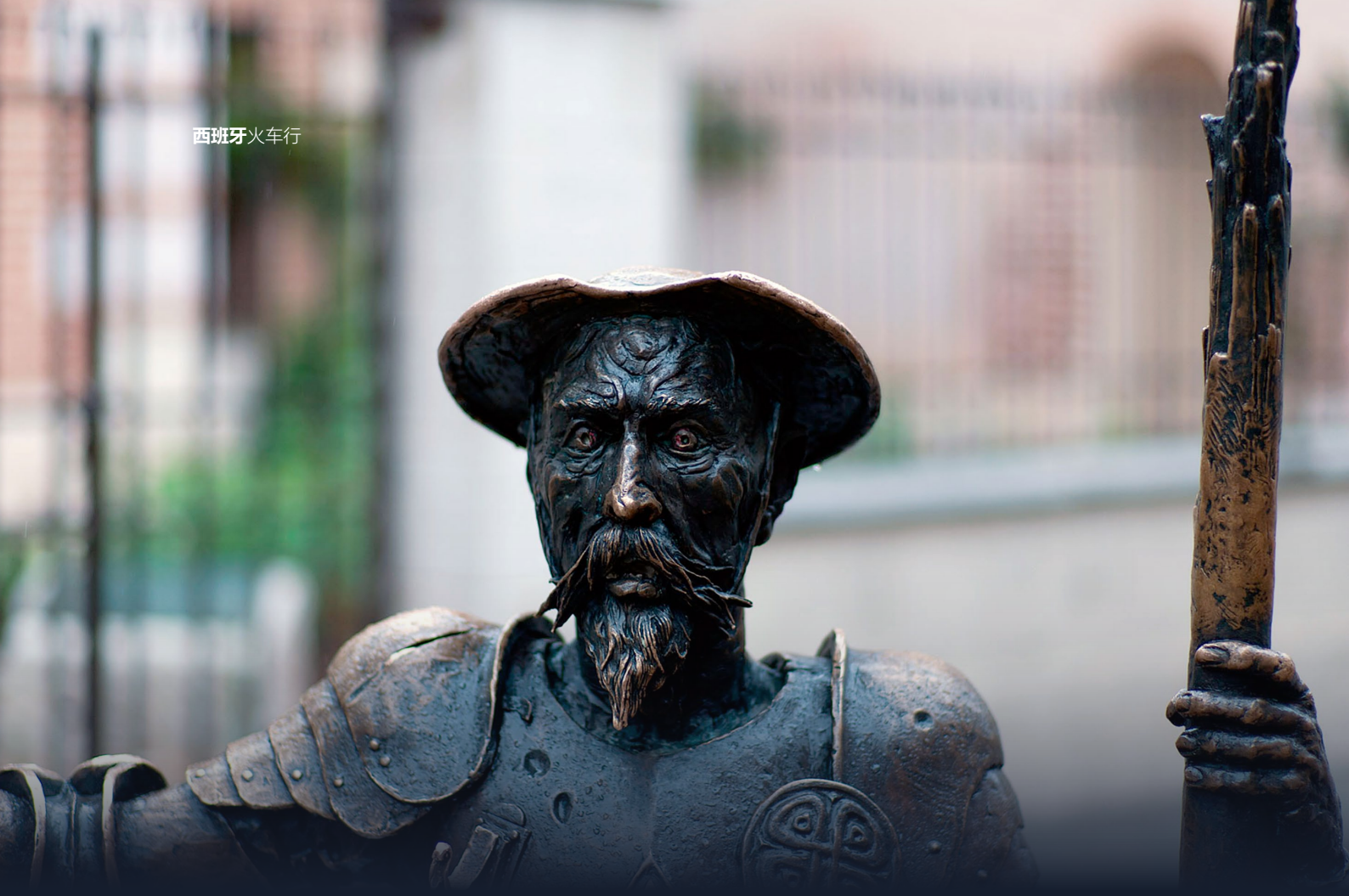
▲ 唐吉珂德的雕塑 阿尔卡拉德埃纳雷斯，马德里