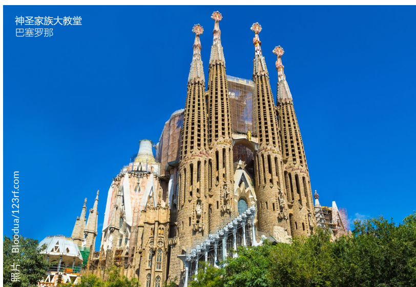
神圣家族大教堂 巴塞罗那