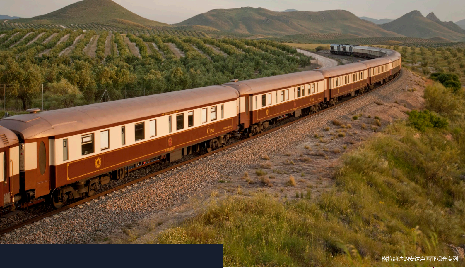
格拉纳达的安达卢西亚观光专列