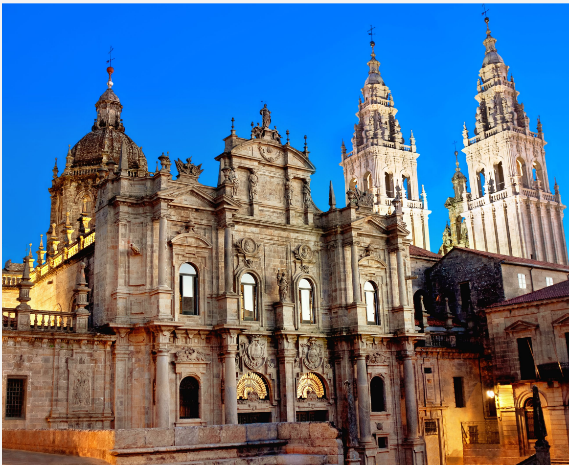
▲ 圣地亚哥大教堂 圣地亚哥-德孔波斯特拉