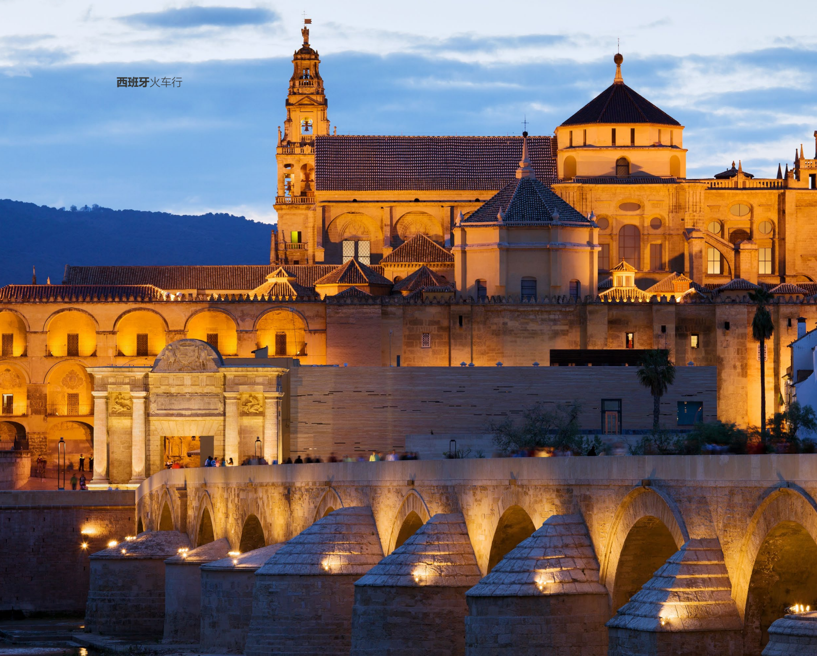
▲ 清真寺-大教堂 科尔多瓦