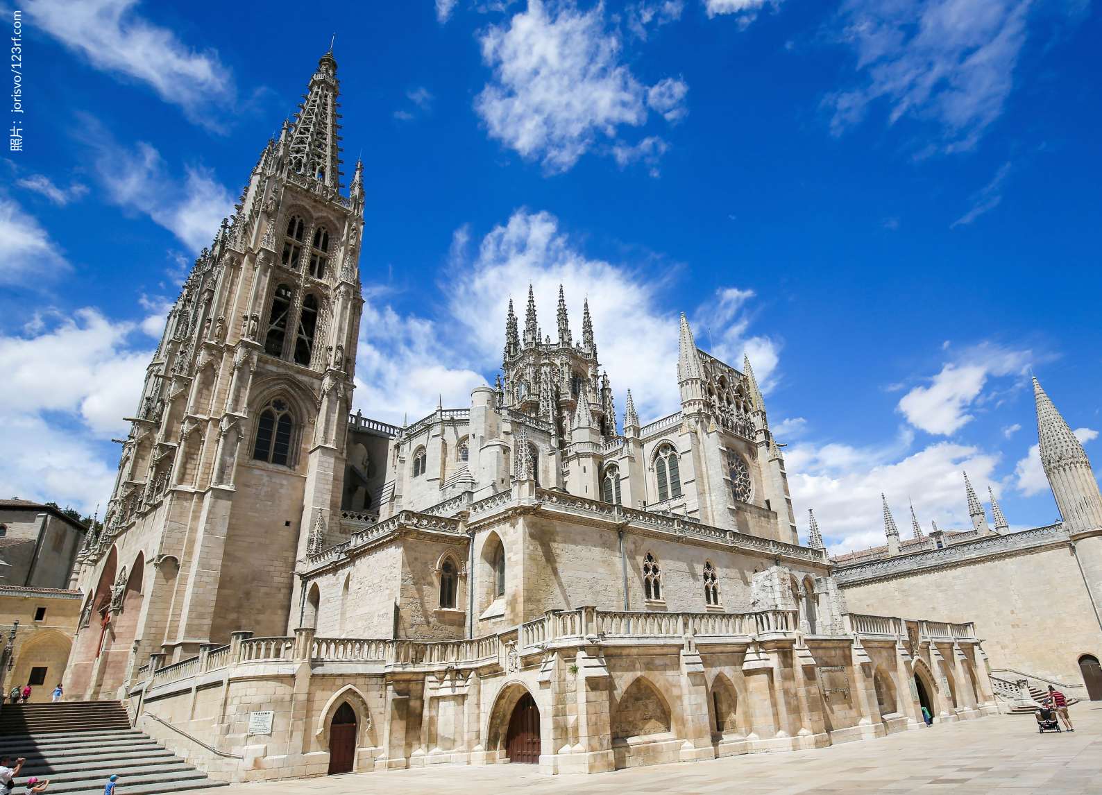
▲ 大教堂 布尔戈斯