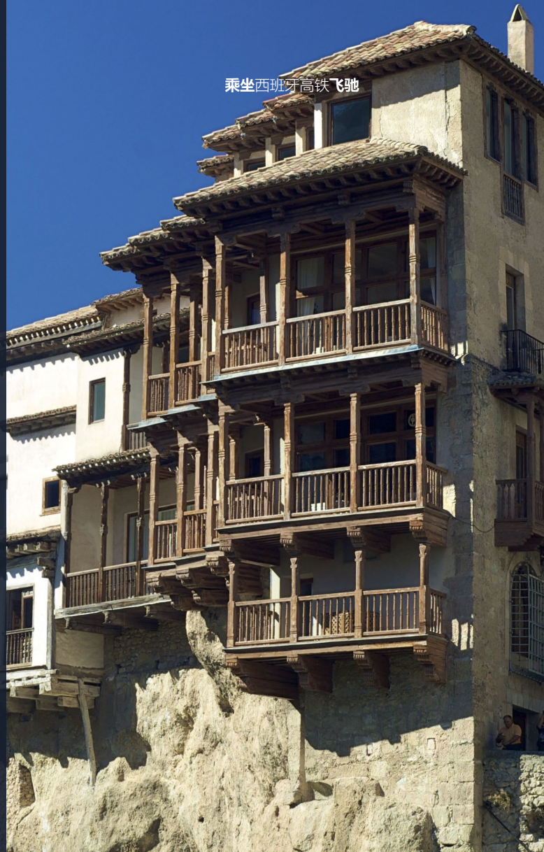
▶ 悬屋 昆卡