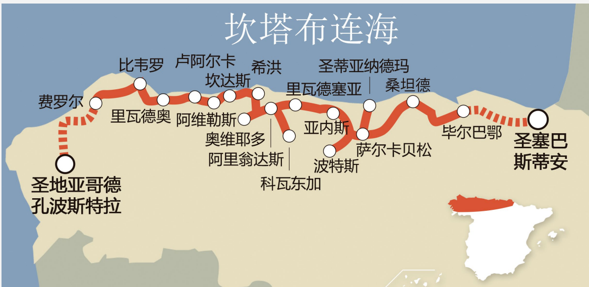
▼ 跨坎塔布里亚豪华火车线路

你可以在14间装饰精美的豪华套房中的一间休息，透过私人套房的车窗或是沙龙车厢的大落地窗，可以欣赏窗外壮丽的景色，沙龙车厢是1923年的原版，是具有历史意义的铁路瑰宝。