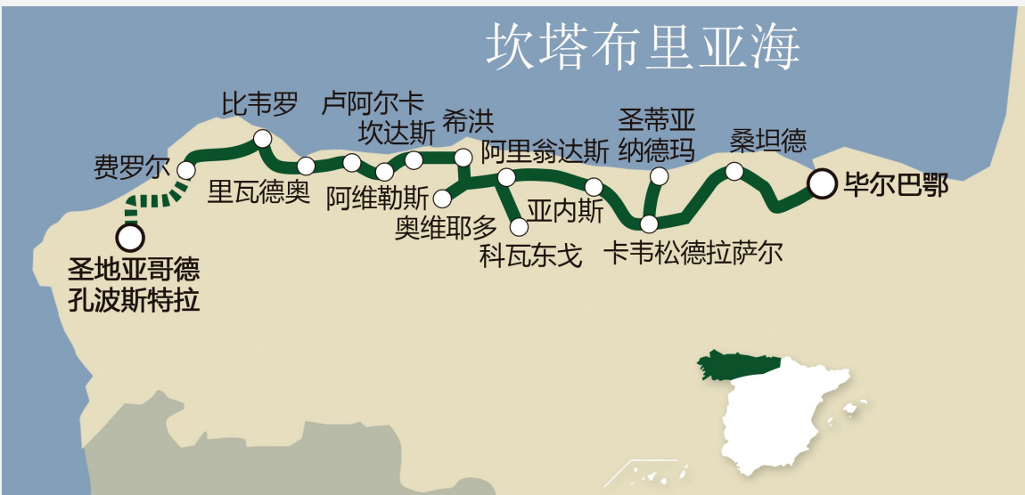
▼ 绿色海岸快车线路

这是从圣地亚哥-德孔波斯特拉到毕尔巴鄂（或从毕尔巴鄂到圣地亚哥-德孔波斯特拉）游览绿色西班牙的另一个绝佳选择。在为期六天的行程中，你将发现巴斯克地区、坎塔布利亚、阿斯图里亚斯和加利西亚最美丽的城市，途中为你提供全心全意的招待和舒适的享受，品尝精选西班牙美食。