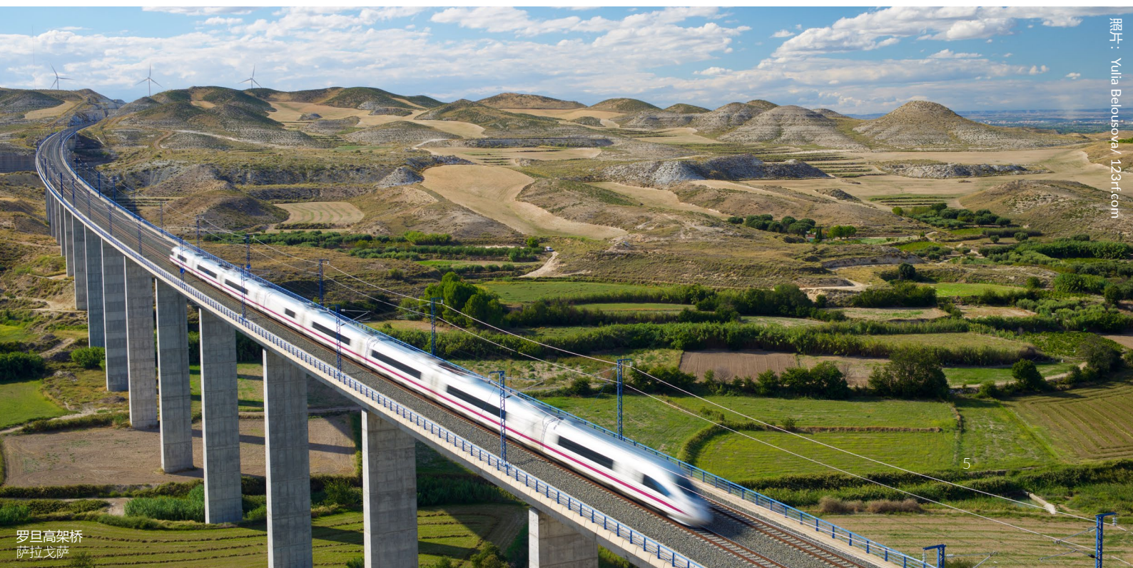
罗旦高架桥 萨拉戈萨