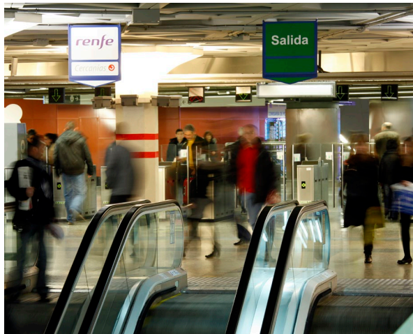
▲ 阿托查火车站 马德里

如果你在马德里，可以尝试中世纪火车，在一天时间内感受历史、戏剧和美食。列车不知不觉间就开到了瓜达拉哈拉的美丽小镇锡古恩萨（Sigüenza）：差不多一个半小时的时间，你就会来到中世纪氛围的村庄里，这里都是穿着传统服饰的演员，重现当年的剧中人物：吟游诗人、杂耍艺人……你还可以在车上品尝各种甜点。到达终点时，会有当地导游来陪同你游览。雄伟的大教堂、城堡和主广场会让你爱上这里。为了满足食欲，你可以尝尝炒面包屑或是卡斯蒂亚汤等当地特色菜肴。如果你喜欢甜食，可以试试蛋黄糕。