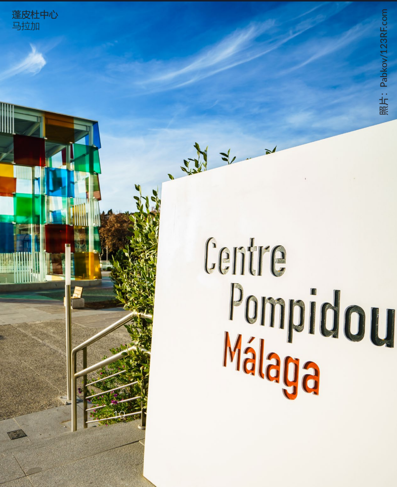
蓬皮杜中心 马拉加