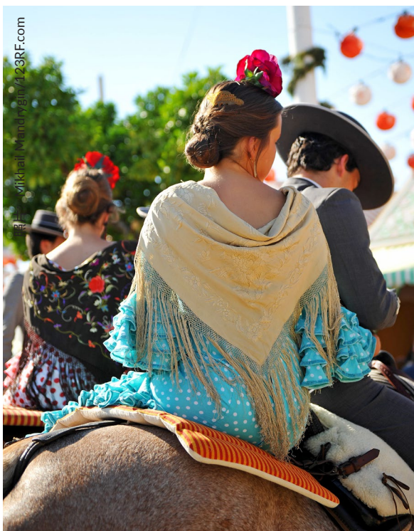
▲ 塞维利亚四月节 塞维利亚