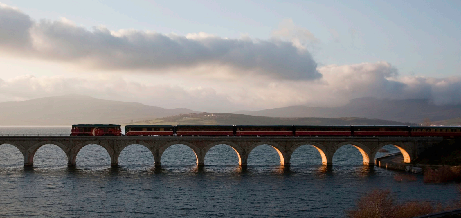
▲ 罗夫拉 (ROBLA) 快车