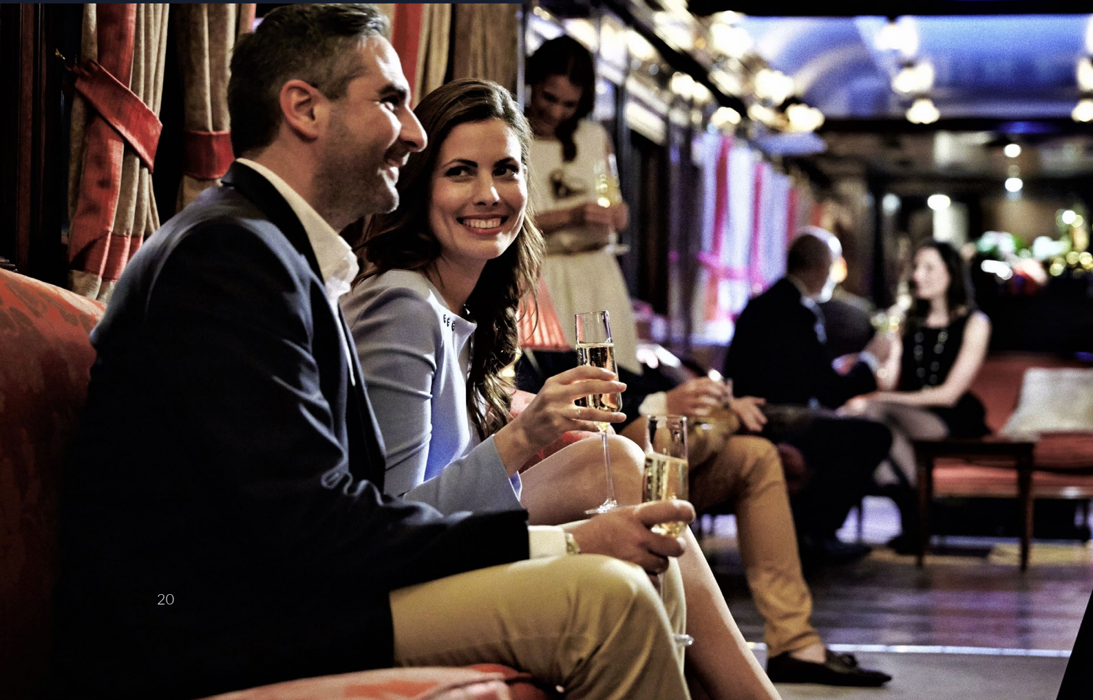
安达卢西亚观光专列