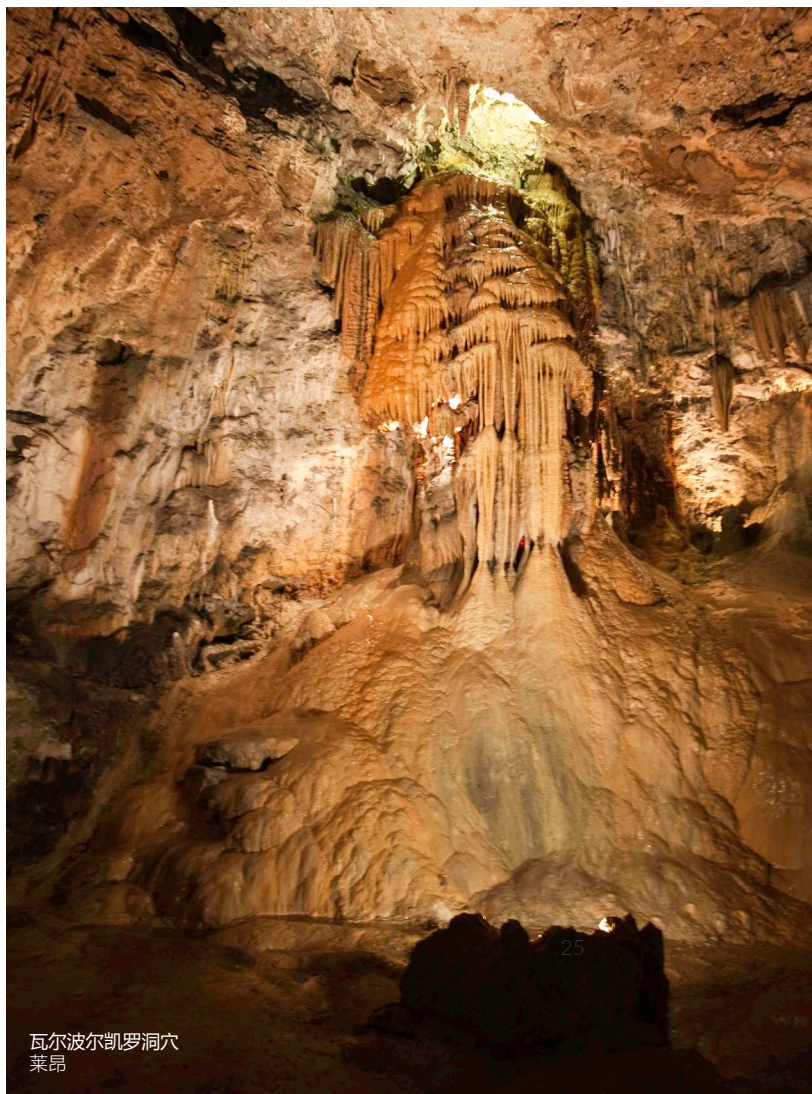
瓦尔波尔凯罗洞穴 莱昂

最后一天，你可以穿越令人难以置信的梅纳（MENA）山谷，前往毕尔巴鄂。到达毕尔巴鄂后，你将了解这座城市并参观著名的毕尔巴鄂古根海姆博物馆。