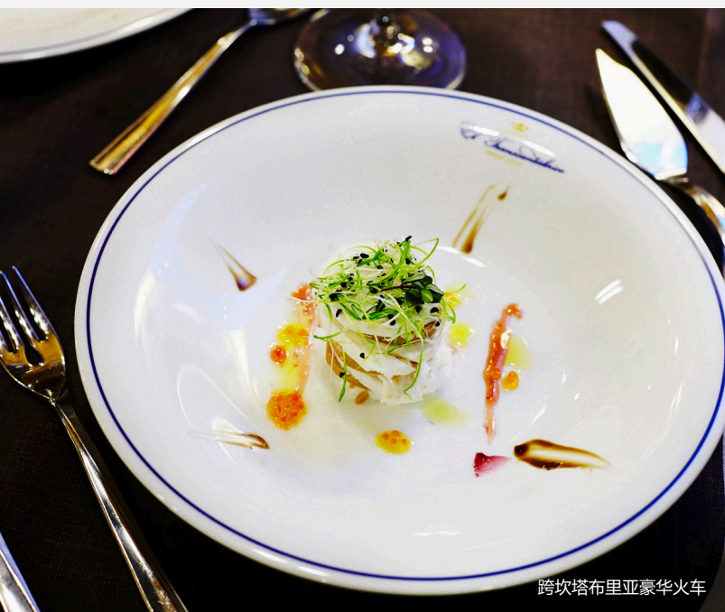
跨坎塔布里亚豪华火车

在经过巴斯克地区、坎塔布里亚、阿斯图里亚斯和加利西亚的途中，你可以享受西班牙北部享有盛誉的美食。不论是在车厢内外，你都可以品尝由享誉全球的顶尖厨师精心烹饪的传统美食。美食种类繁多，从炖白豆、香肠炖白豆、烤鱼、凤尾鱼到海鲜应有尽有。当然少不了甜点、馅饼、香肠以及各个区域特有的葡萄酒。你也可以根据自己的口味，在预订旅行时点上为自己专门订制的美食。