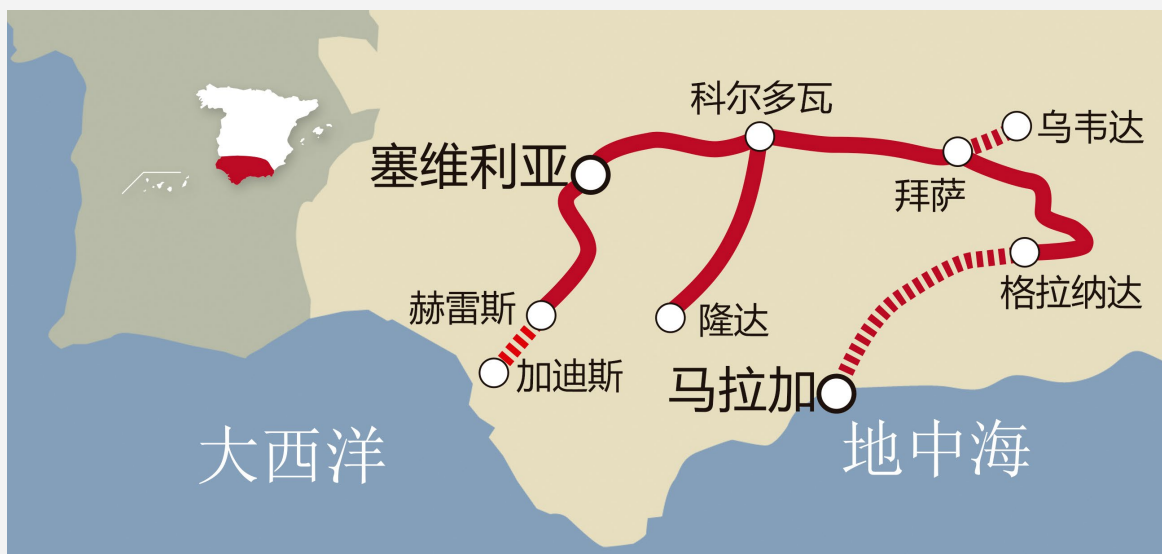
▲ 安达卢西亚观光专列线路