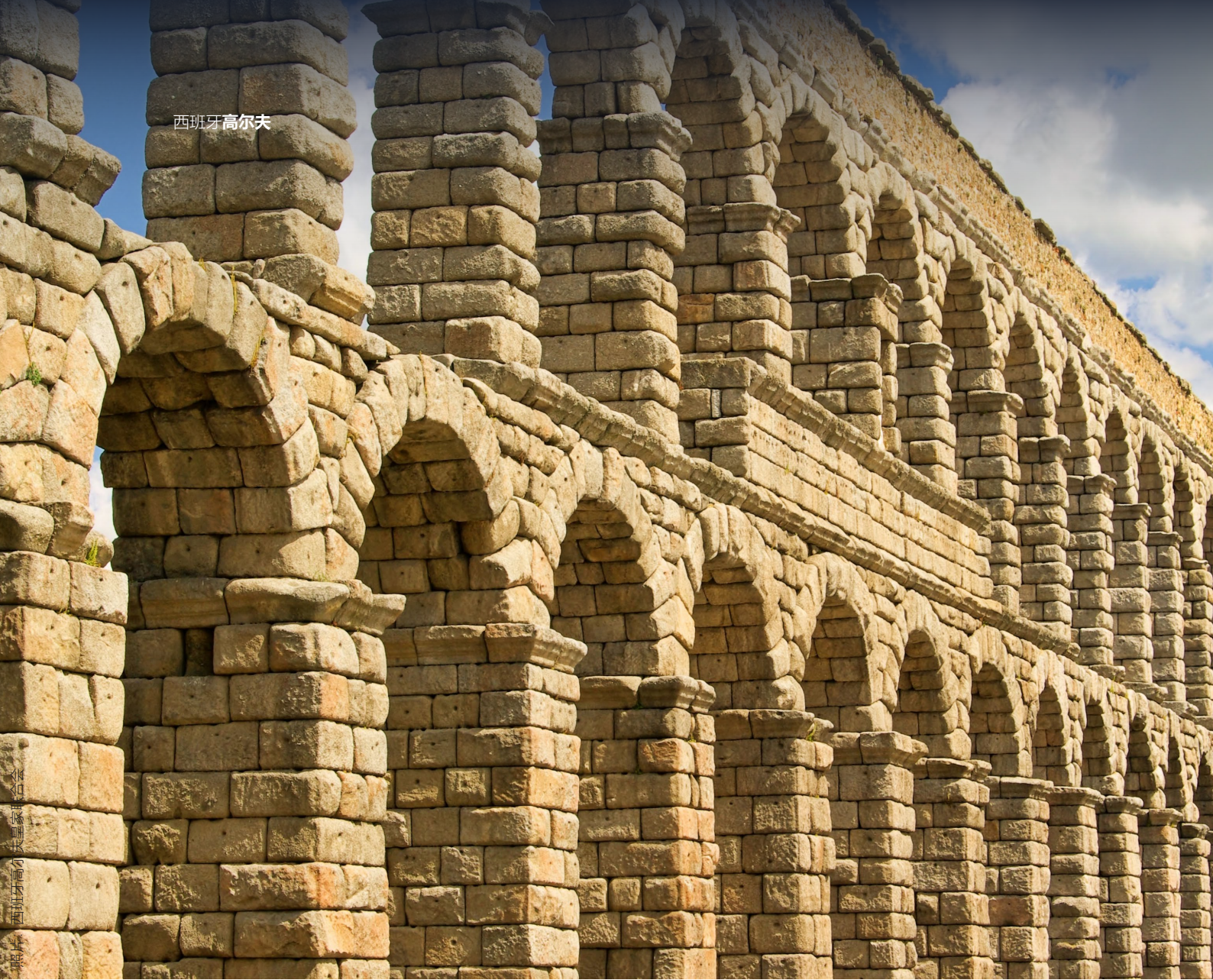
▲ 塞哥维亚的古罗马引水渠