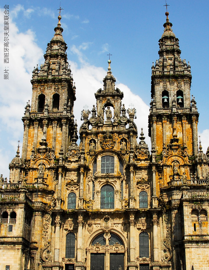
▲ 圣地亚哥大教堂 圣地亚哥-德孔波斯特拉