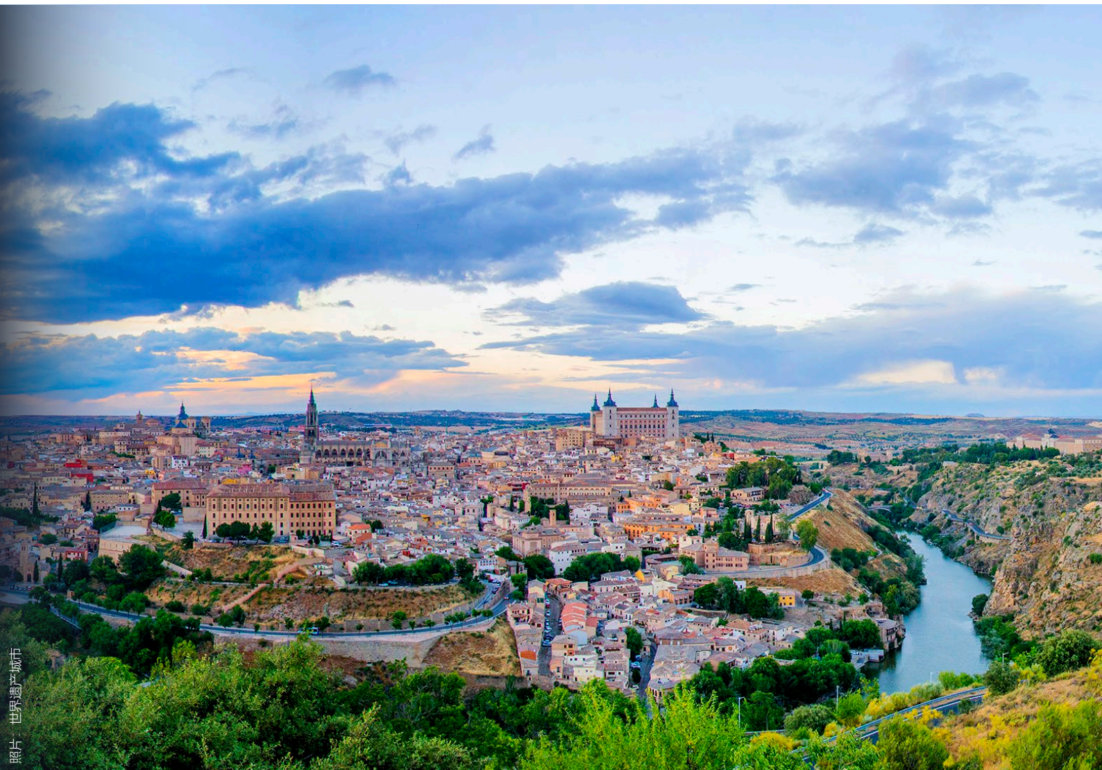
照片：世界遗产城市