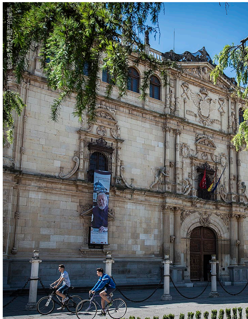
照片：被命名为世界遗产的城市

在距离其历史老城区很近的地方坐落着Encín Golf高尔夫球场。球场趣味横生，共有18洞，绝对让你发挥所有潜能。此外还有其附近小镇Los Santos de la Humosa球场的融合的美感。如果你想提升球技，那么你可以在这里找到西班牙最好的练习场之一，这里共有练习位置100多个。离市中心稍远还有El Robledal球场这个适合所有级别球员的场地。该场地越过低矮的群山以及圣栎树林，其不规则的高低起伏的地面和为考验你球技而设置的障碍充满挑战。