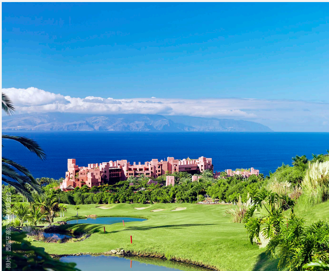
▲ GUÍA DE ISORA 的ABAMA GOLF高尔夫俱乐部 特内里费

我们建议你将对高尔夫球和美食的热爱结合起来。这也是一种有趣且美味的深入了解当地美食以及发现新的可以练习击球地点的方式。