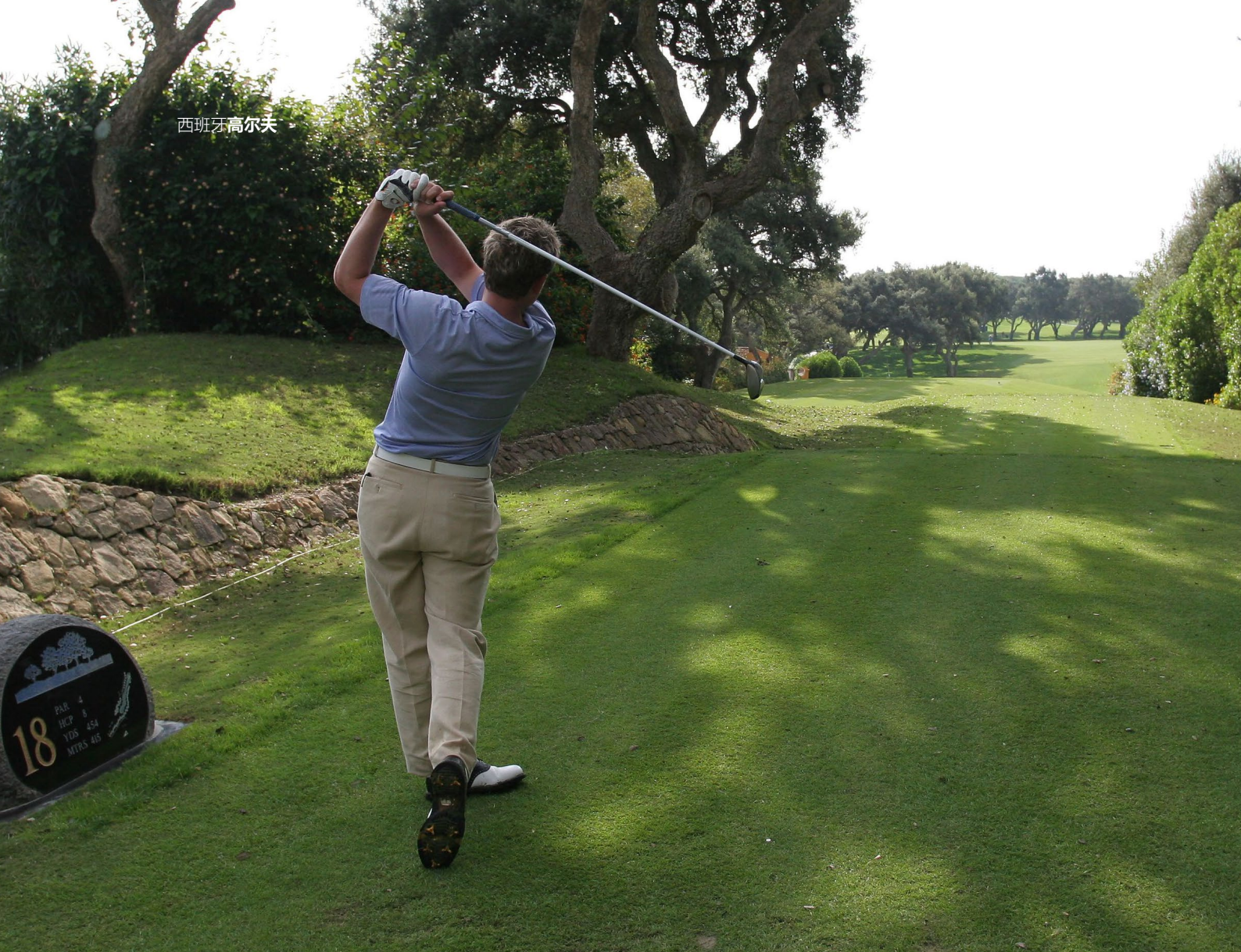
▲ 瓦尔特拉玛高尔夫俱乐部 加迪斯